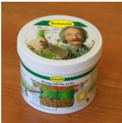
Raupenleim zum direkt auftragen

Naturleim, aus nachwachsenden Rohstoffen, kompostierbar und regenwurmfreundlich.